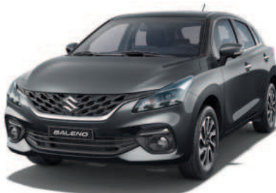
Gris metálico perlado