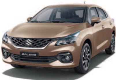
Beige metalico perlado